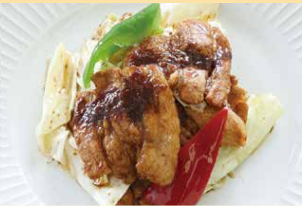
ホイコーロー 回鍋肉