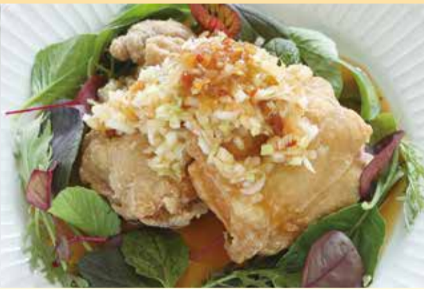
ユーリンチー 油淋鶏