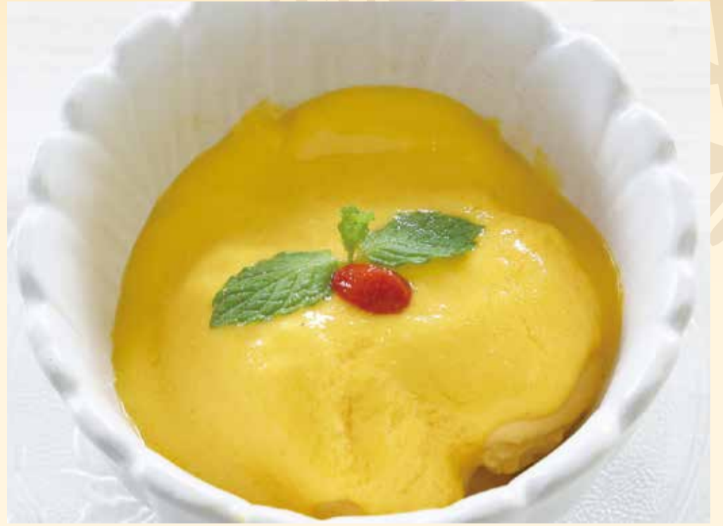
マンゴープリン (お一人様用) ..... 500円 (税込550円)