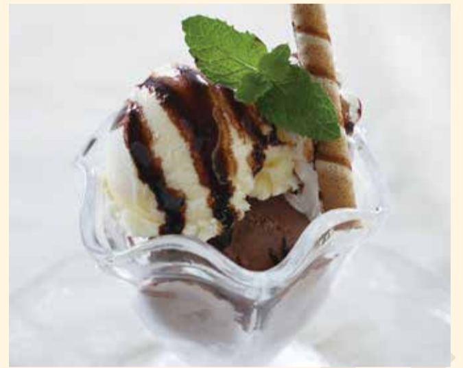
オセロアイス (お一人様用) ... 450円 (税込495円)