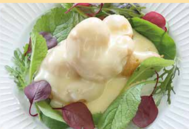
エビのマヨソース和え