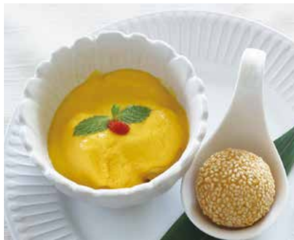
B ミニマンゴープリン + 胡麻団子