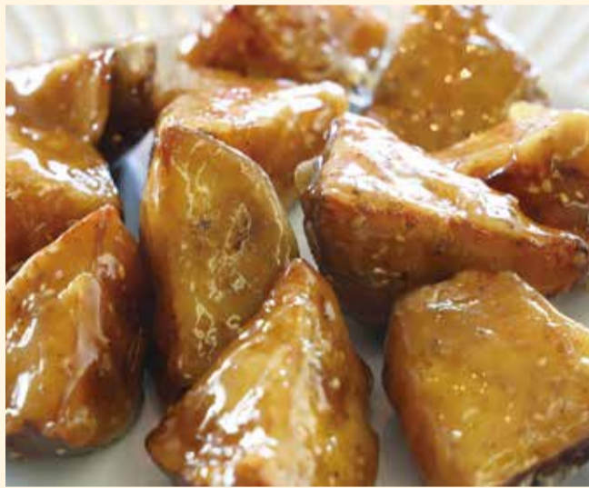
イモアメ (10ヶ) ..... 800円 (税込880円)