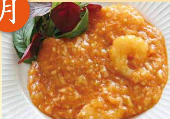
エビのチリソース煮