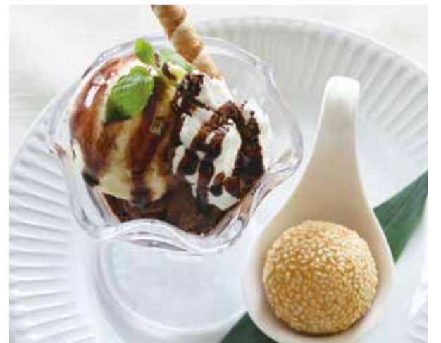
C ミニオセロアイス + 胡麻団子