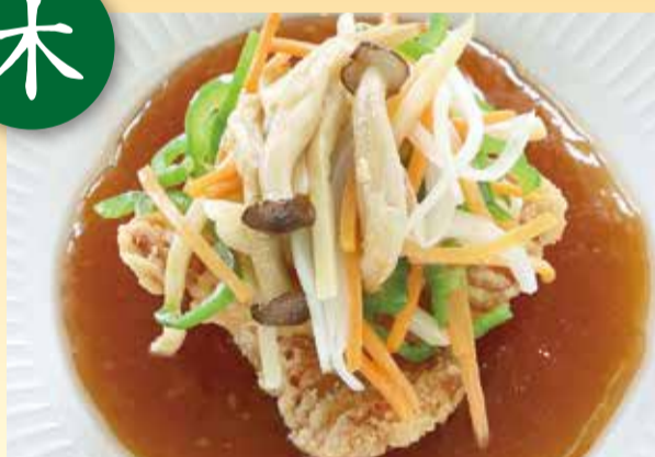
白身魚の五目甘酢餡