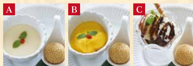
A ミニ杏仁豆腐 + 胡麻団子 B ミニマンゴープリン + 胡麻団子 C ミニオセロアイス + 胡麻団子