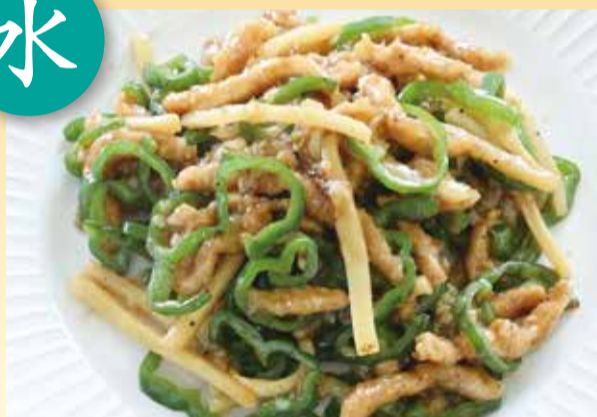
チンジャオ ロース 青椒肉絲