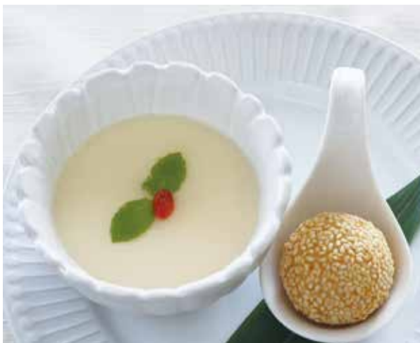
A ミニ杏仁豆腐 + 胡麻団子

◎定食をご注文のお客様 + 300円 (税込) でプレミアムデザートに変更できます。(デザート・コーヒーは食後にお申し付けください。)