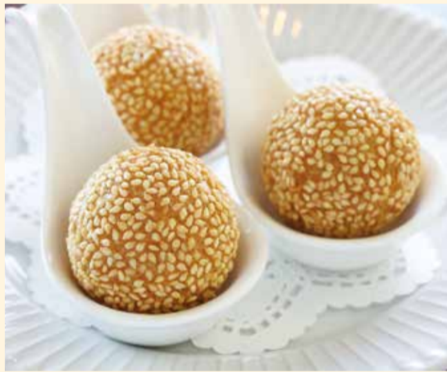
ゴマダンゴ 胡麻団子 (3ヶ) ..... 450円 (税込495円)