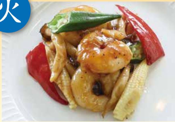
エビのオイスターソース炒め