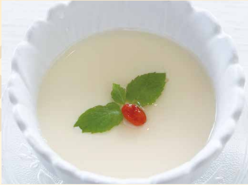
アンニン ドウフ 杏仁豆腐 (お一人様用) ..... 450円 (税込495円)

謙張のデザートがパワーアップして新登場。 食後でもさらっと食べられる重くないデザート。